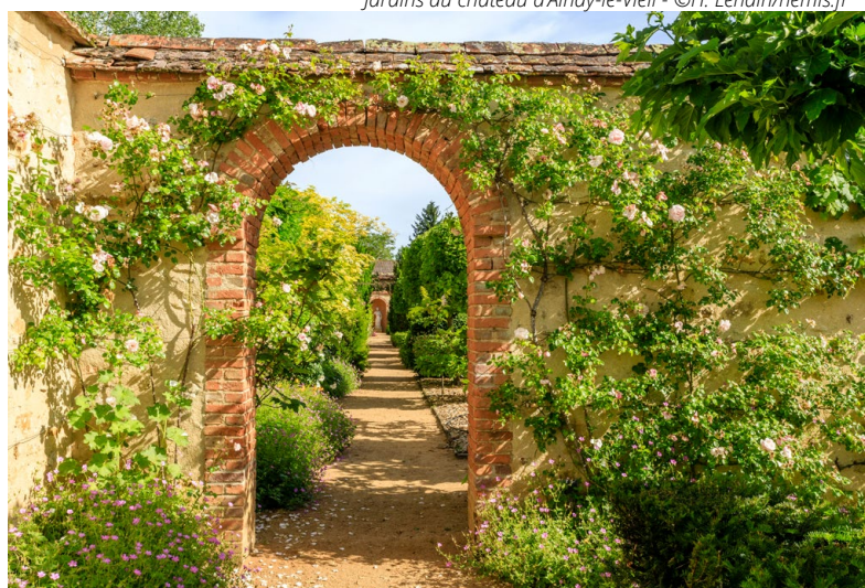
Jardins du château d'Ainay-le-Vieil

Surnommée le « petit Carcassonne » en raison de sa poterne et de ses remparts, le château d'Ainay-le-Vieil est situé au cœur d'un parc à l'anglaise de 7 hectares , où se dressent des arbres centenaires dont certains exceptionnels : cyprès chauve aux racines résurgentes, catalpa bicentenaire d'Amérique, etc. Une roseraie rassemble quelque 180 variétés de roses botaniques et de roses anciennes. Par l'attribution de cette deuxième étoile, les auteurs du Guide Vert ont souhaité souligner la beauté de ces jardins et les soins constants apportés au château, admirablement meublé.