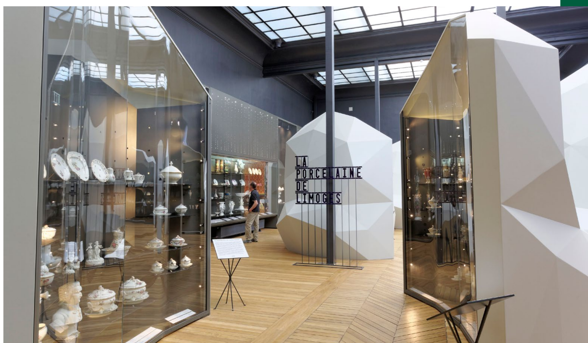
Musée national de la Porcelaine Adrien-Dubouché

Des paysages sauvages d'une grande variété, des vallées profondes et des milliers de cours d'eau, font le charme d'une région où il faut prendre son temps. Du sud de la Corrèze au nord du Cher, les auteurs du nouveau Guide Vert MICHELIN Limousin Berry soulignent le côté nature, slow tourisme et patrimoine local de la destination, en décernant huit nouvelles étoiles à des sites qui répondent aux tendances actuelles de tourisme durable. Tour d'horizon des nouveautés 2023 du Guide !