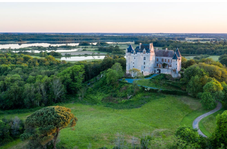
Le château du Bouchet

Bâtie sur une assise de rochers rouges, cette imposante forteresse médiévale fut restaurée aux XV e et XVII e siècles . Aujourd'hui, après une formidable mise en valeur, véritable aventure familiale, le château dévoile au grand public des pièces d'époque : salle à manger, cuisine d'apparat (collection de plus de 1 000 cuivres), grand salon, chambres, bibliothèque... Un peu plus loin, les visiteurs accèdent au donjon médiéval par un escalier, avant de se retrouver dans la salle aux trésors . Après avoir fait le tour du château, direction la terrasse pour profiter d'une vue magnifique sur la Brenne et sur l'étang de la mer Rouge , sans doute le panorama le plus spectaculaire de la Brenne !